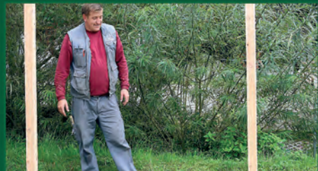
4. Pfosten in Anker einsetzen