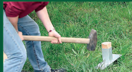
1. Erster Pfostenanker in den Boden einsetzen