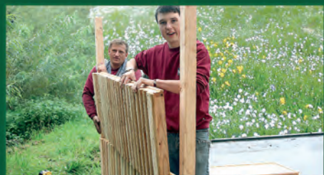
8. Zweites Lärmschutzmodul befestigen