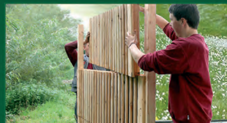
9. Drittes Lärmschutzmodul befestigen