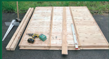
HS-Material und Werkzeug bereitlegen