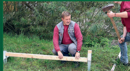
3. Zweiter Pfostenanker einsetzen