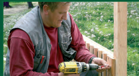
7. Befestigung (mitgelieferte Edelstahlschrauben)