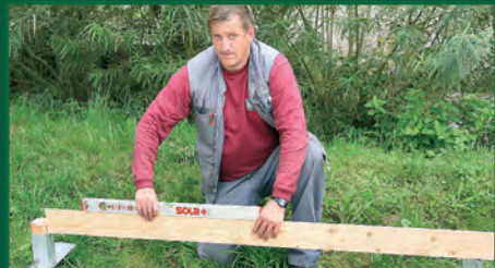
2. Pfostenankerabstand ausrichten