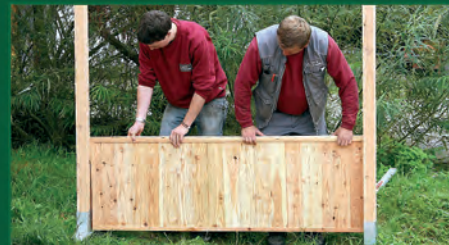
5. Erstes Lärmschutzmodul einsetzen