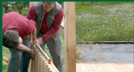
6. Erstes Lärmschutzmodul ausrichten