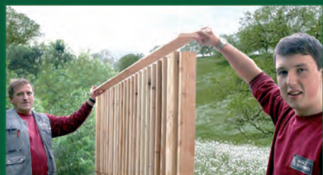
10. Regenabdeckung befestigen